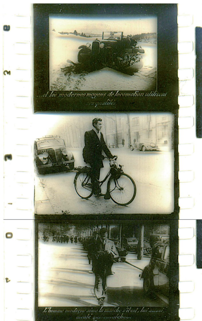
Figura 7 - Imagen extraída del film fixe “La marche”

Esta misma línea argumental es la que podemos encontrar en varios de los documentos analizados, en particular, en el film fixe “La marcha”, confeccionado por una empresa que fabricaba calzados en base a caucho. Allí, a pesar de incorporar numerosos elementos biomecánicos y fisiológicos de la marcha humana, e incluso luego de buscar demostrar los beneficios económicos que representaría el uso de este tipo de calzados, acaba apelando al mismo recurso, de tal modo que si, al referir al caucho “...les modernes moyens de locomotion utilisent ses qualités.”, entonces “L’homme moderne aime la marche, s’il est, lui aussi, monté sur caoutchouc.” 50