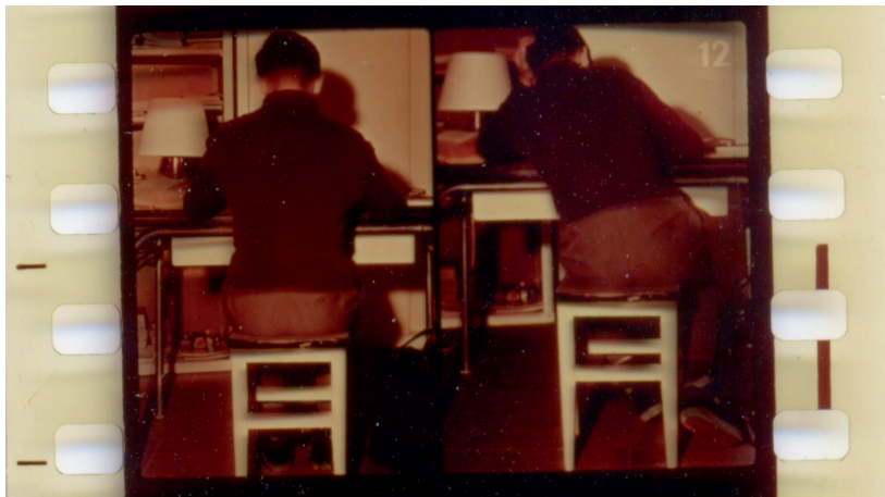
Figura 1 - Imagen extraída del film fixe “Hygiène du squelette” (Higiene del esqueleto)

Esto no supone una novedad respecto a otros registros, tales como los manuales de higiene y los manuales escolares; de hecho existen punto de evidente coincidencia, tanto a nivel de los campos de conocimiento que les dan sostén -en ambos casos, digámoslo una vez más, el predominio evidente es el de la fisiología y de la anatomía, aunque con una presencia muy fuerte de una dimensión moral no necesariamente derivada de ninguna de ellas-, como en las indicaciones concretas que tanto en unos como en otros aparecen. Por ejemplo, en la imagen de una “correcta posición” sentado y una “incorrecta posición”.