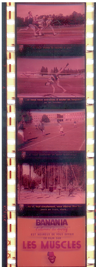
“Figura 5 - Imagen extraída del film fixe “Les muscles” 48

Razón, vida, ciencia y salud tendieron a complementarse y por momentos a indistinguirse. Esto quiere decir que aquello que era presentado como racional -y en este sentido la ciencia fue casi un sinónimo excluyente de razón-, al mismo tiempo debía ser bueno para nuestra vida y por lo tanto contribuiría en el mantenimiento y en la mejora de nuestra salud. En este sentido, el film fixe titulado “La poussière ennemie de notre santé” proponía, a partir de esta asociación entre salud y razón, que “Pour préserver notre santé, pour vivre dans un atmosphère sain, déclarons la guerre aux poussière (...) Le recherches se sont donc orientées vers de MOYENS de DÉFENSE PLUS RATIONNELLE. Dans l’industrie, le puissantes aspirateurs sont prévues dans les machines-outils.” 47