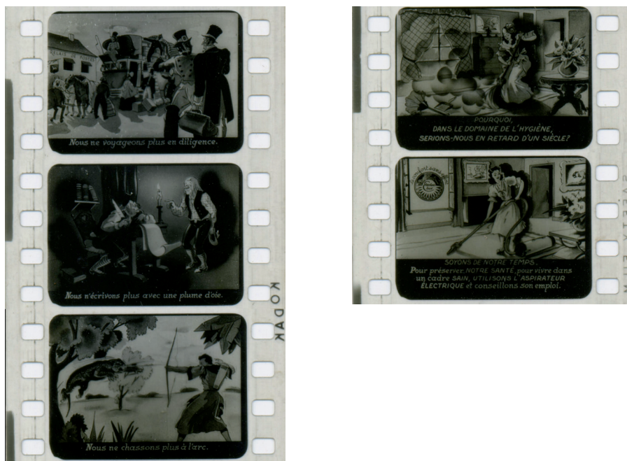
Figura 6 - Imagen extraída del film fixe “La poussière ennemie de notre santé” 49

Si bien desde el punto de vista epistémico este razonamiento es bastante débil, desde el punto de vista comercial parece haber servido para la construcción de un discurso lo suficientemente organizado y bien direccionado como para alcanzar un relativo éxito.