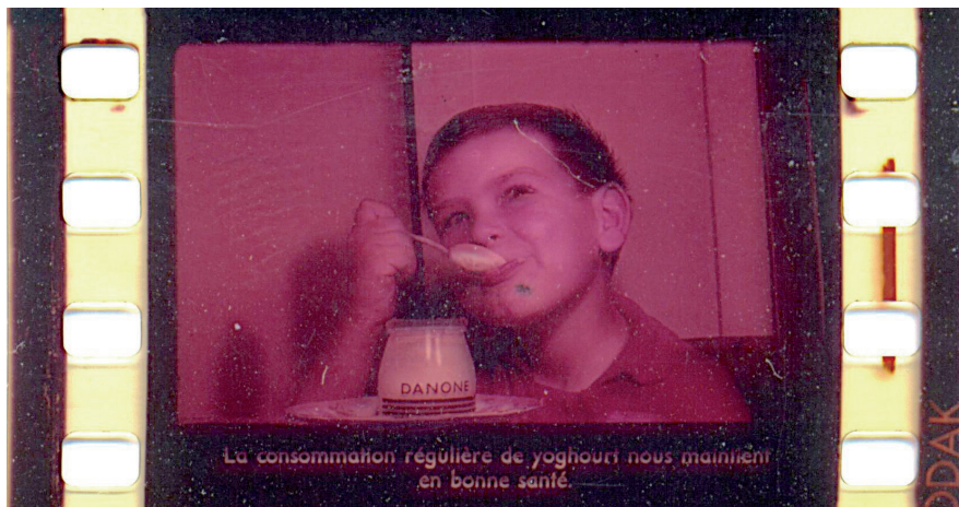
Figura 8 - Imagen extraída del film fixe “Les bons microbes”

No es mi intención resolver la cuestión de las ventajas o límites que tuvo la incorporación de los films fixes como herramientas educativas. Asumo que es posible que, como afirman tanto Nourrison (2014) como Goutanier y Lepage (2008), la utilización de este material haya estado asociada a una búsqueda por renovar los modos de educación y a la incorporación de nuevas metodologías de enseñanza; así como que, como también proponen Goutanier y Lepage (2008), algunos de los límites dados por sus propias características hayan implicado un cierto desuso frente a otras innovaciones.