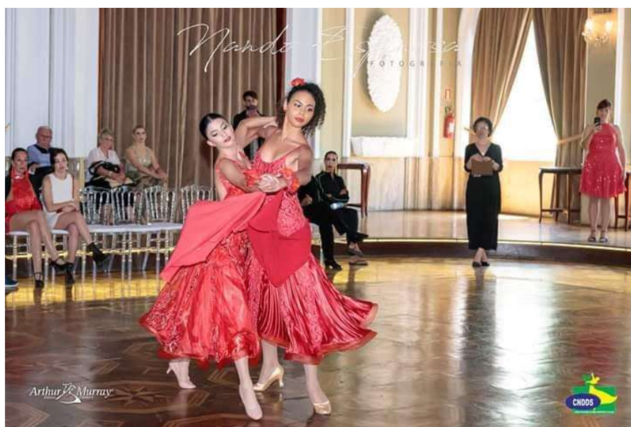
Legenda: Campeonato Brasileiro de Dança Esportiva 2019, em Porto Alegre Categoria Standard Same Gender (por Nando Espinosa)

Sobre as potenciais competições esportivas de dança de salão internacional foi apresentado ao grupo que nosso país foi o primeiro a criar competições oficiais vinculadas ao CNDD, inclusive com casais compostos por pessoas do mesmo gênero. Esta iniciativa pioneira coloca o Brasil em destaque no cenário das danças esportivas, promovendo a diversidade de expressões sexuais e de gênero, e almejando a inclusão social de corpos plurais e desgenerificados.