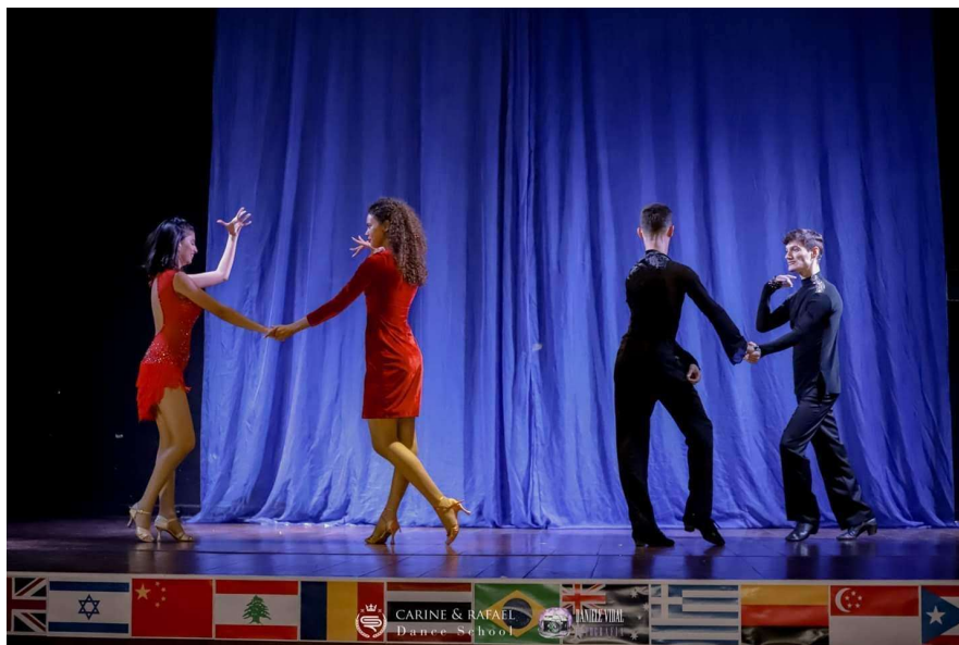
Legenda 2: Mostra coreográfica de Latin Same Gender (por Daniele Vidal)