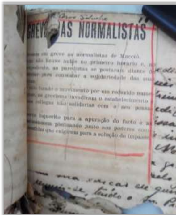
Figura 4 – Inquérito – Greve das Normalistas em Maceió – 1934

Fonte: Arquivo Público de Alagoas. Caixa 4975.