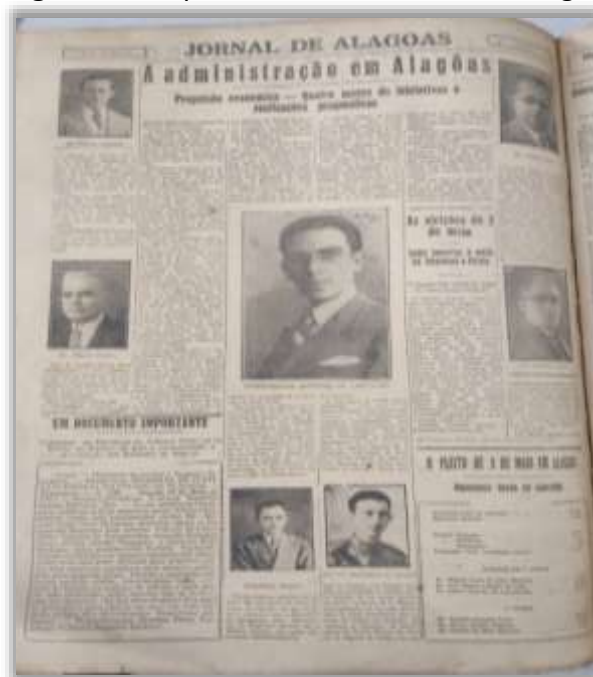
Figura 1 – O quadro administrativo em Alagoas