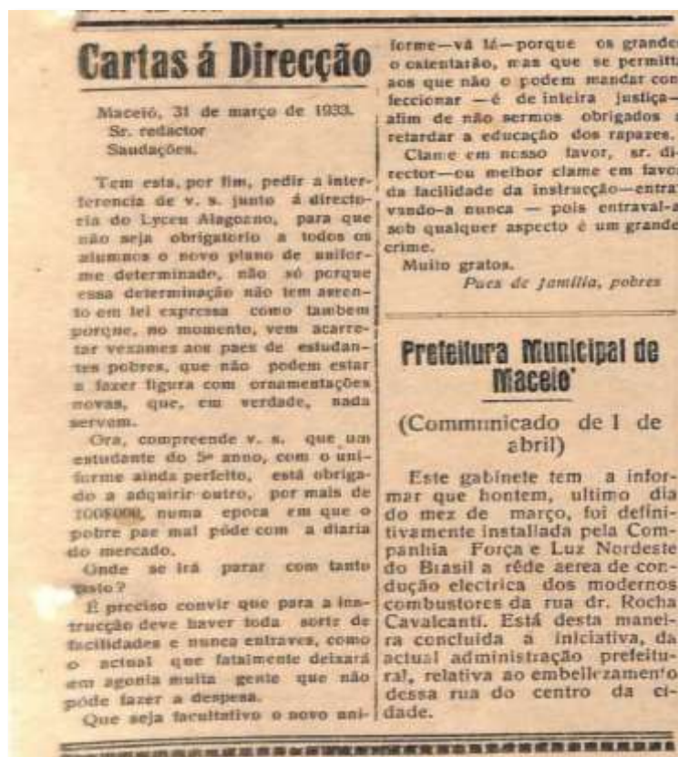
Figura 2 – Carta pública às Diretorias