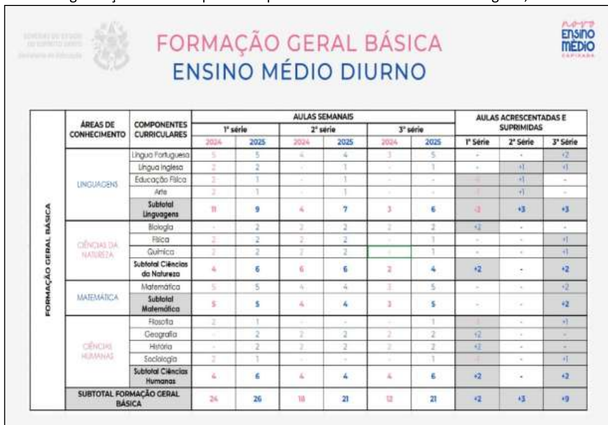
Tabela 2: Organização curricular para a etapa do Ensino Médio modalidade regular, turno: Diurno