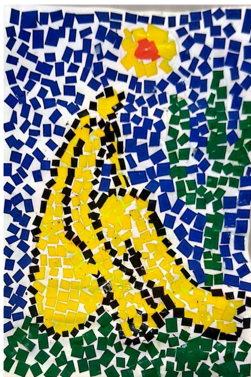
Imagem 2: Releitura Abaporu (de Tarsila do Amaral) com fragmentos de papel

Olhando para trechos da dramaturgia, para recortes daquilo que possa vir a ser um pensamento outro, se fazem retalhos que ampliam a possibilidade de múltiplas interpretações. A montagem desse texto passa longe de um quebra-cabeça: pois no quebra cabeça tudo se encaixa! Tudo está destinado a formar uma imagem esperada... Coletar cacos, recortes, pedaços que se colam, se costuram, se soldam, ainda que nem sempre com firmeza, muitas vezes se soltam e se escapam, possibilitando se perder e ser encontrado. Como encontrar aquilo que não foi perdido?