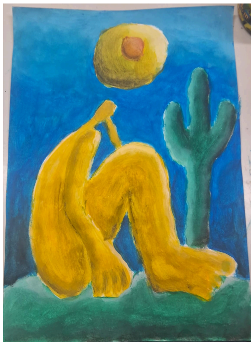
Imagem 3: releitura de Abaporu de Tarsila do Amaral propondo outra corporificação de Abaporu