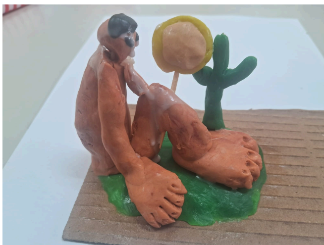
Imagem 4. Modelando e relendo ‘Abaporu’

Remodelando o que pode ser o Abaporu, o que pode ser a antropofagia, para qualquer ponto além do binarismo de ser ou não ser. “As pedras podiam ser lapidadas de muitas maneiras.” (HILST, 1968, p.20)