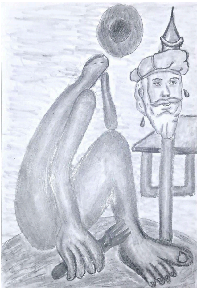
Imagem 5. Releitura de 'Abaporu'(Tarsila do Amaral) devorando o colonizador Pedro Álvares Cabral