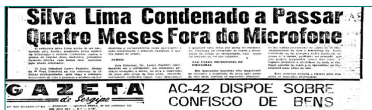
Figura 3: Notícia sobre a condenção de Silva Lima.