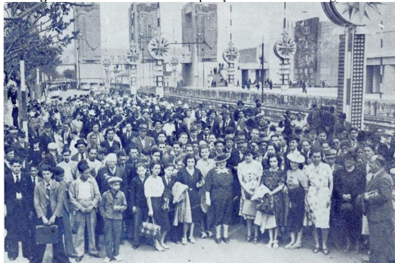
Imagem 1. Patriota excursão à Exposição do Mundo Português XXXVI .