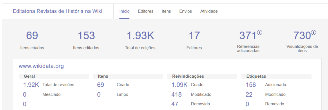
Resultados obtidos com a segunda editatona.