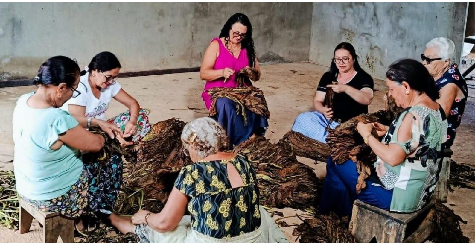
Destaladeiras de fumo de Arapiraca-AL

Revista mantida por grupos de pesquisa em História sediados na Universidade Federal do Rio Grande do Norte (UFRN), na Universidade Federal de Sergipe (UFS) e na Universidade Regional do Cariri (URCA), especializada na publicação de artigos de revisão e resenhas de livros de História e Memória.