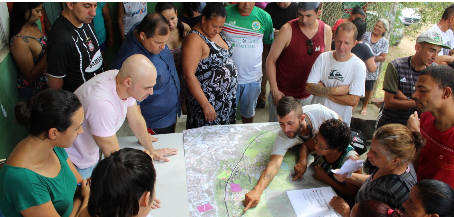
Imagem de atividade do Plano Popular de Urbanização e Regularização Fundiária do Banhado

Revista mantida por grupos de pesquisa em História sediados na Universidade Federal do Rio Grande do Norte (UFRN), na Universidade Federal de Sergipe (UFS) e na Universidade Regional do Cariri (URCA), especializada na publicação de artigos de revisão e resenhas de livros de História e Memória.