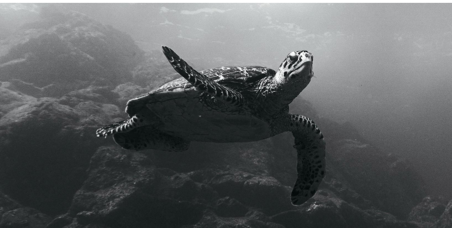
Tartaruga marinha

Revista mantida por grupos de pesquisa em História sediados na Universidade Federal do Rio Grande do Norte (UFRN), na Universidade Federal de Sergipe (UFS) e na Universidade Regional do Cariri (URCA), especializada na publicação de artigos de revisão e resenhas de livros de História e Memória.