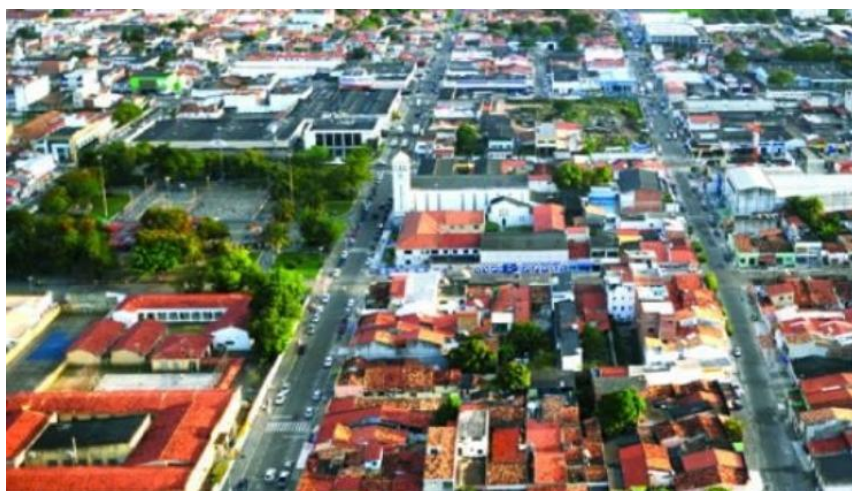
Vista aérea do Bairro Siqueira campos, destacando a Praça D. José Tomaz e a Igreja Nossa Senhora de Lourdes

A última imperfeição está no trato das imagens. Falta um mapa do bairro . Na ausência dele, cada leitor tem que imaginar uma figura para o Aribé (um círculo, uma cruz, um retângulo) e uma escala para as relações com o centro e as adjacências. Há também problemas com as representações fotográficas (Não me refiro ao procedimento normativo de registrar autoria, custódia etc. Trato da contextualização). As imagens compostas nas duas últimas páginas de cada capítulo ou seção têm função estética, mas as da abertura de capítulos compõem textos conexos aos escritos. Bem demarcados os tempos, espaços e circunstâncias de cada uma dessas aberturas, ampliariam o leque de significação de cada biografia.