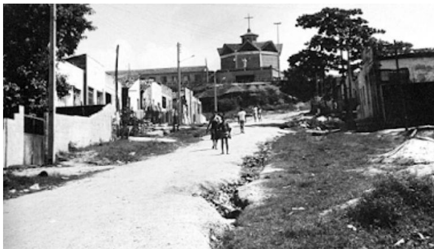
Rua Maria Pureza, Bairro América (Anos 1980) com a igreja São Judas Tadeu ao fundo

Em “A Amaba e a comunicação popular – de 1983 a 1990” (capítulo X), encontram-se o primeiro boletim, produzido em 1984, seguido do Jornal Popular e do jornalzinho Reculturarte , voltado ao público infantil. Enquanto o boletim se restringia a notícias ligadas à mobilização popular da entidade, o jornal reservava metade de suas páginas para notícias relativas ao Estado e ao país; ambos eram ‘colados’ em murais dispostos na Igreja São Judas Tadeu, na sede da entidade, em uma escola estadual e em uma bodega.