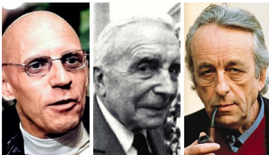
Michel Foucault, Georges Canguilhem e Louis Althusser

O esforço de coesão dos organizadores merece ser reconhecido, dado o caráter multifacetado das contribuições, como não poderia deixar de ser numa coletânea que reúne trabalhos inscritos livremente por seus autores em eventos que almejavam mesmo à pluralidade temática. O uso meramente tateante dos recursos metodológicos da epistemologia histórica por parte de alguns autores do volume não minimiza seus méritos por tê-los identificado. Pode-se lamentar que o livro tenha, ainda, um caráter muito internalista, negligenciando os frutíferos diálogos que a epistemologia histórica tem mantido com a história cultural e a geografia dos saberes, por exemplo. Aliás, a desconsideração pela virada espacial, que ajudaria a mostrar, inclusive, a força política dessa forma de crítica histórica das racionalidades científicas, é algo inevitavelmente percebido por qualquer leitor não europeu do livro.