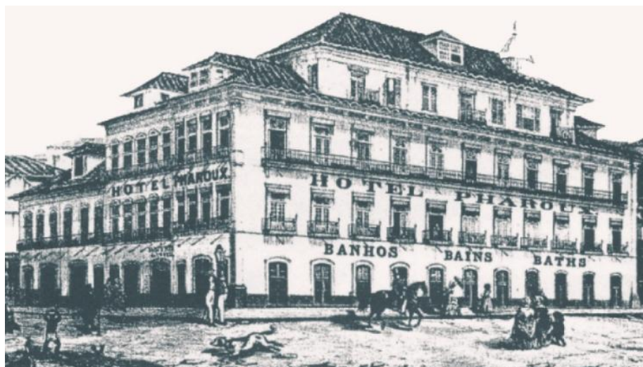
1830 – Inaugurado o hotel Pharoux, de proprietário francês, com restaurante especializado em cozinha e vinhos franceses. Hotel Pharoux: 1 Imagem: Andrade et al (2009)

Os capítulos 7, 8, 9, 10 e 11 retomam o formato integral em cronologia. Eles se ocupam, instituições públicas, entidades de classe, operadoras, congressos, feiras (7), normativas da Embratur, legislação sobre empresas prestadoras de serviços, sobre guias de turismo, agências, meios de hospedagem (8), legislação nacional e estadual relacionada (9), inauguração de parques de diversão e temáticos (10) e escolas e cursos formadores, encontros de estudantes, defesas de teses e dissertações e lançamento de periódicos e livros especializados em turismo (11).