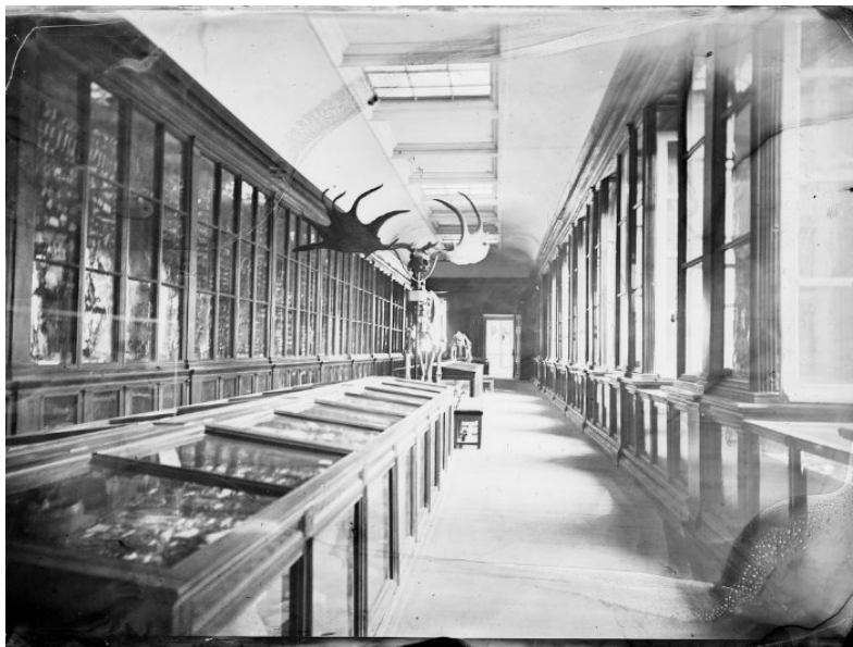
III.2. Vers 1870. "Musée de Toulouse - Galerie des cavernes". Plaque négative au collodion au format 13x18cm. Inv. MHNT.PHa.138.T.048

indépendant de l'école de Médecine. Ces deux institutions ont cohabité et se sont d'ailleurs confondues juridiquement jusqu'en 1870. En 1872, Jean-Baptiste Noulet, naturaliste et préhistorien prend la direction de l'établissement. Avec Émile Cartailhac et Eugène Trutat, il crée « la galerie des cavernes » qui est la première au monde à exposer du mobilier préhistorique.