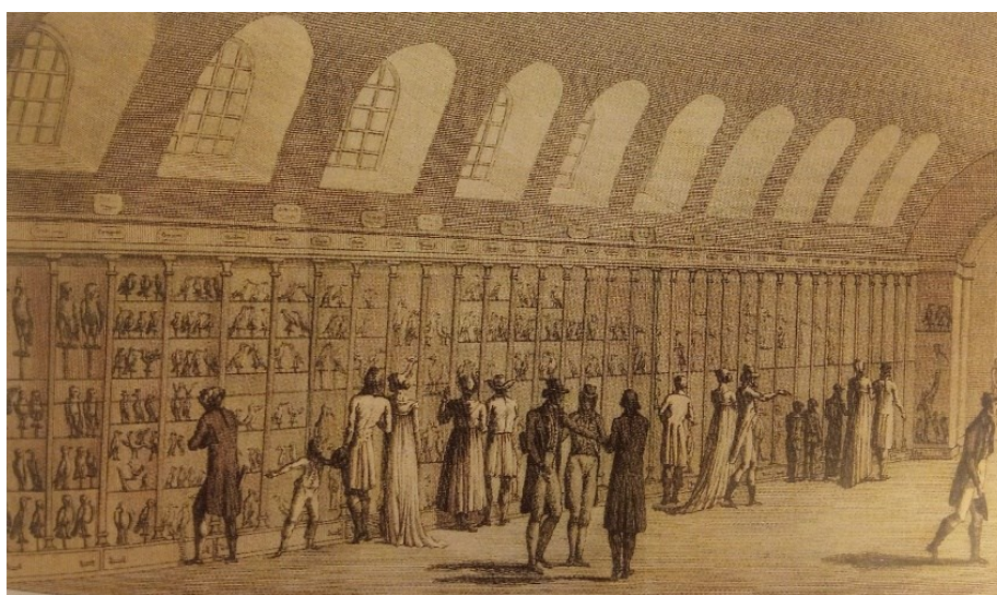
III.1. La Grande Galerie du Muséum d'Histoire naturelle de Paris (illustration de J.-B. Pujoux. Promenades au Jardin des Plantes à la Ménagerie et dans les galeries du Muséum d'Histoire Naturelle tome 2, Paris, 1803)

Nous aimons partitionner, catégoriser pour ordonner le monde qui nous entoure et nous le rendre intelligible, saisissable. L'histoire des musées est tortueuse, mais lorsque l'institution émerge au cours du XVIIème siècle, elle va recouvrir différents établissements relevant chacun d'une thématique : les arts, l'histoire, les sciences... C'est dans ce contexte que naît en France le Jardin royal des plantes médicinales, en 1636, prémices du futur Muséum national d'Histoire naturelle, lui-même précurseur des différents muséums d'histoire naturelle du territoire.