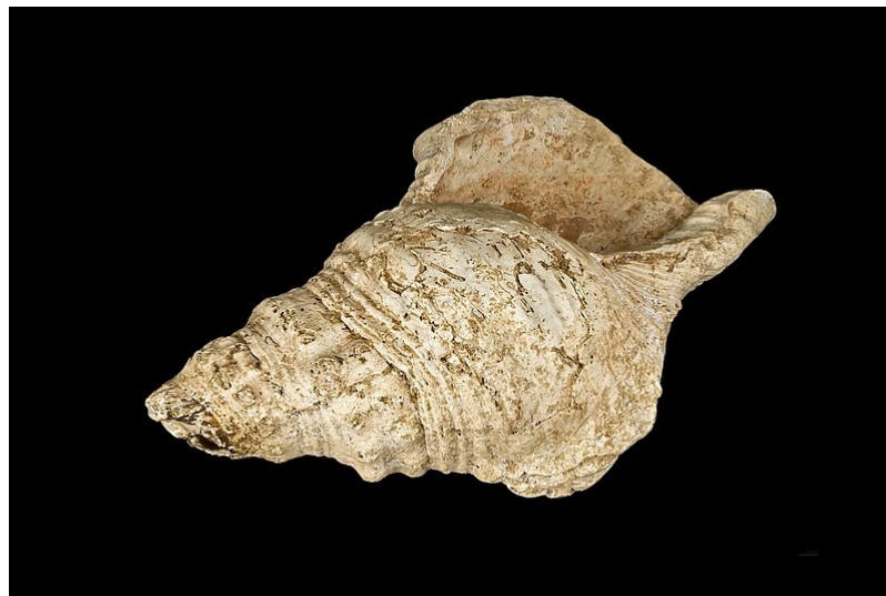
III.4. Conque Magdalénienne de Marsoulas. Inv. MHNT.PRE.2013.0.492. Collection du Muséum de Toulouse.

formidable outil pour la conservation, la restauration et la connaissance des pièces. Plusieurs spécimens ou objets ont pu bénéficier de cette technologie.