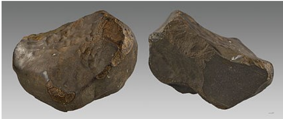
III.3. La météorite "Chondrite EH5" dit de Saint-Sauveur. Coll. du Muséum de Toulouse. Inv. MHNT.MIN.2001.1

environ 500, dont beaucoup ne sont que de petites pierres (< 5g ou < 1,5 cm 3 ) trouvées en Antarctique. Seules 16 chutes de ces météorites ont été répertoriées dans le monde au cours des deux derniers siècles, dont celle de Saint-Sauveur en 1914". (BARRAT et JAMBON, 2014, p.17) Plusieurs fragments ont été distribués comme notamment au Muséum national d'Histoire naturelle. Ce dernier a dû se séparer d'une partie de son fragment pour répondre aux demandes de plusieurs laboratoires.