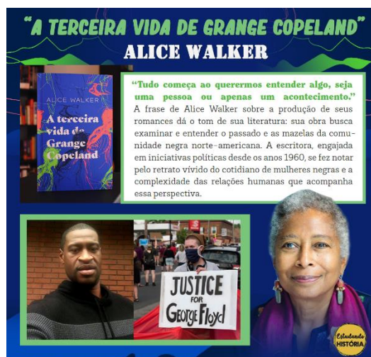
Figura 1 – Indicação da obra “A Terceira Vida de Grange Coopeland”