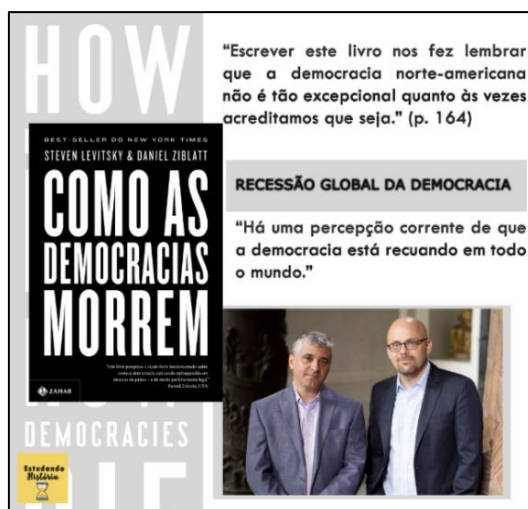
Figura 2 – Indicação da obra “Como as democracias morrem”