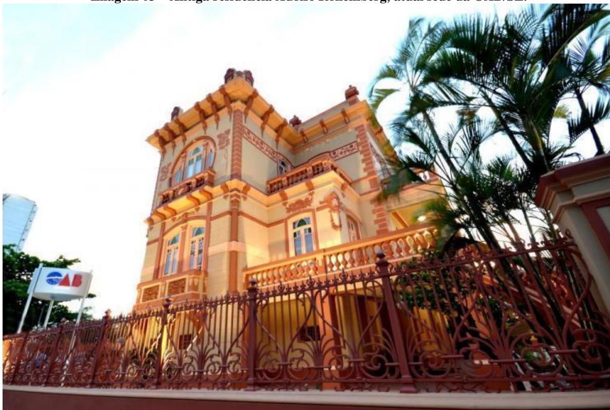
Imagem 03 – Antiga residência Adolfo Rollemberg, atual sede da OAB/SE.