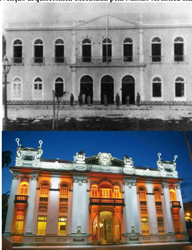
Imagem 02 – Palácio Olímpio Campos, também conhecido como Palácio do Governo. O antes e depois da intervenção arquitetônica executada pela Missão Artística Italiana.