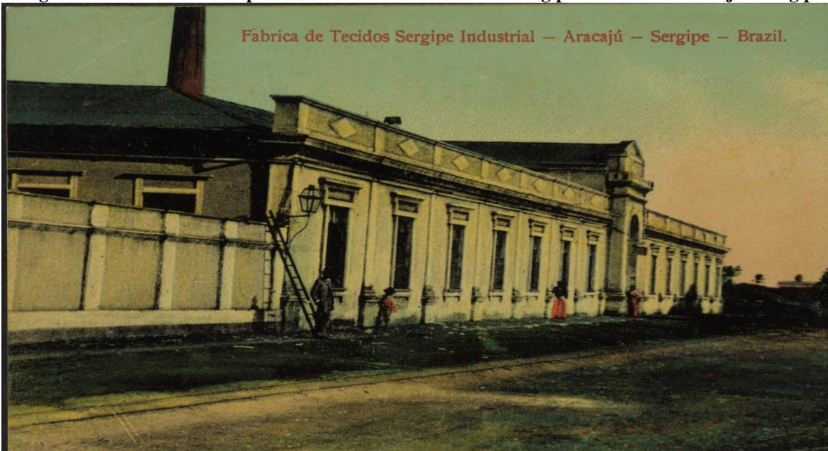
Imagem 01 – Bloco industrial pertencente a Fábrica de Tecidos Sergipe Industrial – Aracaju – Sergipe.