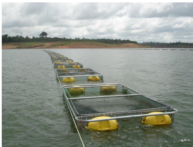
Figura 2 Tanques-rede instalados no parque aquícola de Breu Branco III no reservatório da Usina Hidrelétrica de Tucuruí, estado do Pará.

A produção se iniciou em abril de 2011 e as primeiras despescas ocorreram em abril de 2012, sendo a maior parte do pescado comercializado com a Companhia Nacional de Abastecimento (Conab) por meio do Programa de Aquisição de Alimento (PAA) na modalidade “compra da agricultura familiar com doação simultânea”.